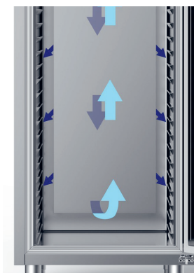
Umluftsystem mit Luftleitblech